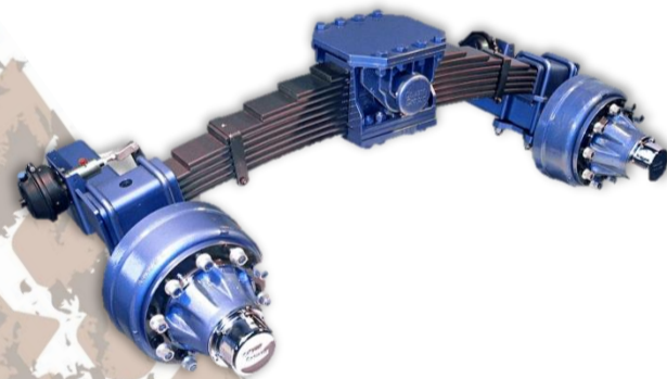
Tandem à lames