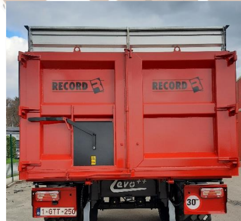
Dubbele hydraulische deur (optie)