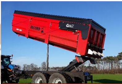
Halve hoogkipper KMR 1850