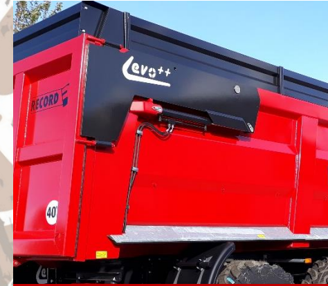
Cilinders van de hydraulische deur beschermd en uitgerust met slangbreukbeveiligers en terugslagklep