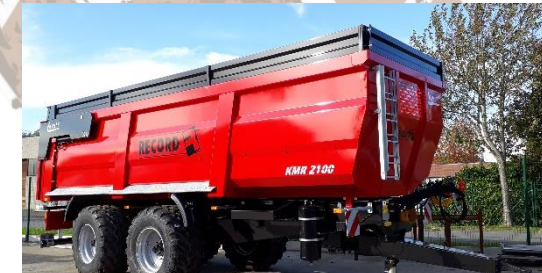
Spatborden op de bak + ¼ spatborden PVC