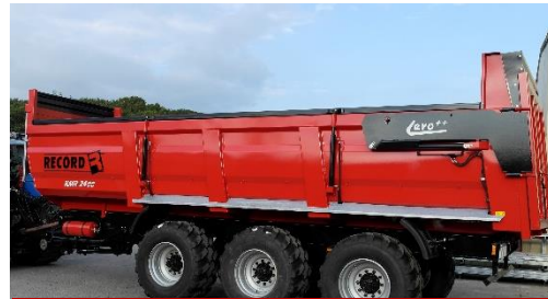
Hydraulische zijschoven KMR 2400