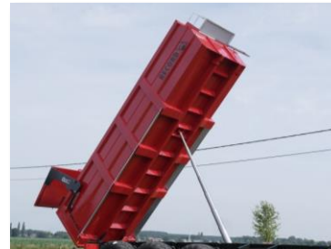
KMR 2400 L in gekipte stand