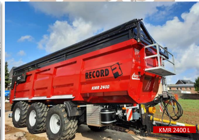
KMR 2400 L