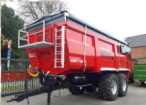
Manuele oprolbache met looprek