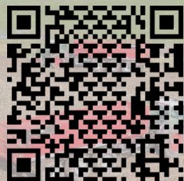
KMR 2400 L