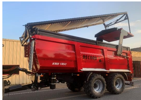
Automatisch afdeksysteem met waterdicht zeil