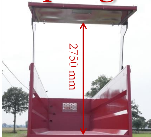
Vrije hoogte onder de hydraulische deur indien volledig geopend: 2750 mm