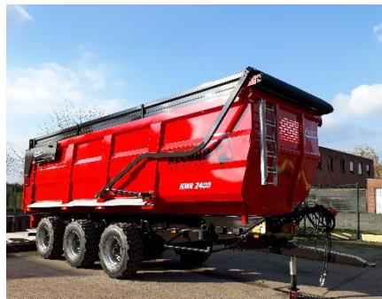
Hydraulisch afdeksysteem met gaasdoek