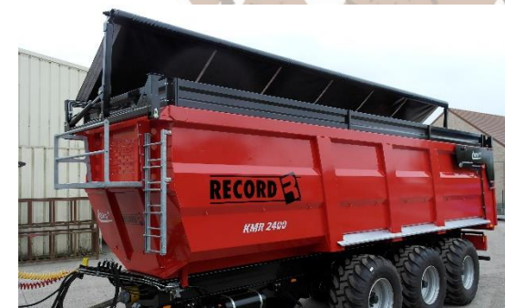
Automatisch afdeksysteem met waterdicht zeil