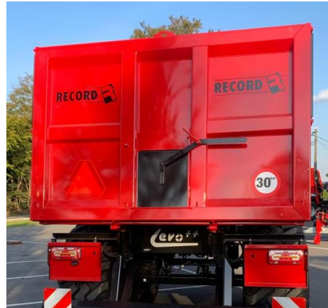
Standaard hydraulische deur LED vrachtwagenverlichting