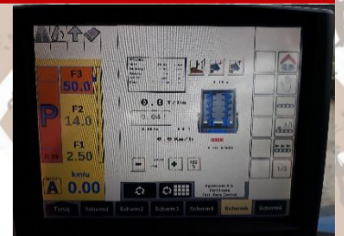
1 - Standaard